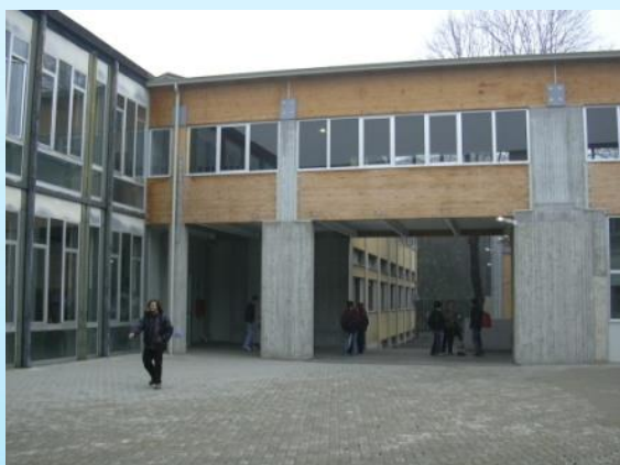
LICEO SCIENTIFICO E LICEO DELLE SCIENZE UMANE CORTILE INTERNO