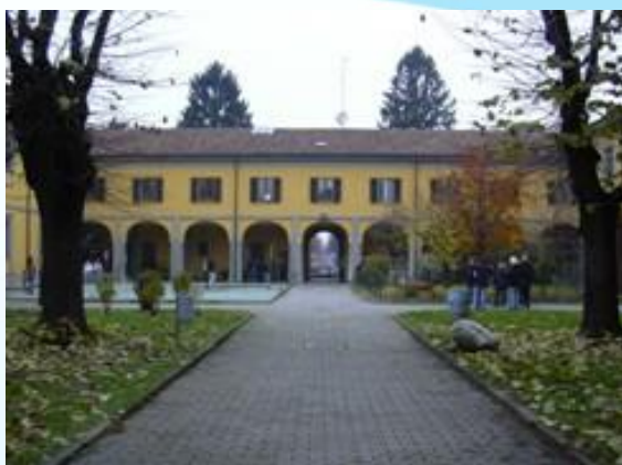
ISTITUTO TECNICO ECONOMICO E LICEO DELLE SCIENZE UMANE CORTILE INTERNO